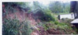
写真2 人家裏斜面の崩壊状況