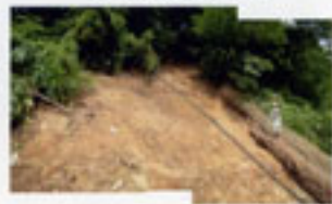
写真3 長大斜面上部の崩壊状況